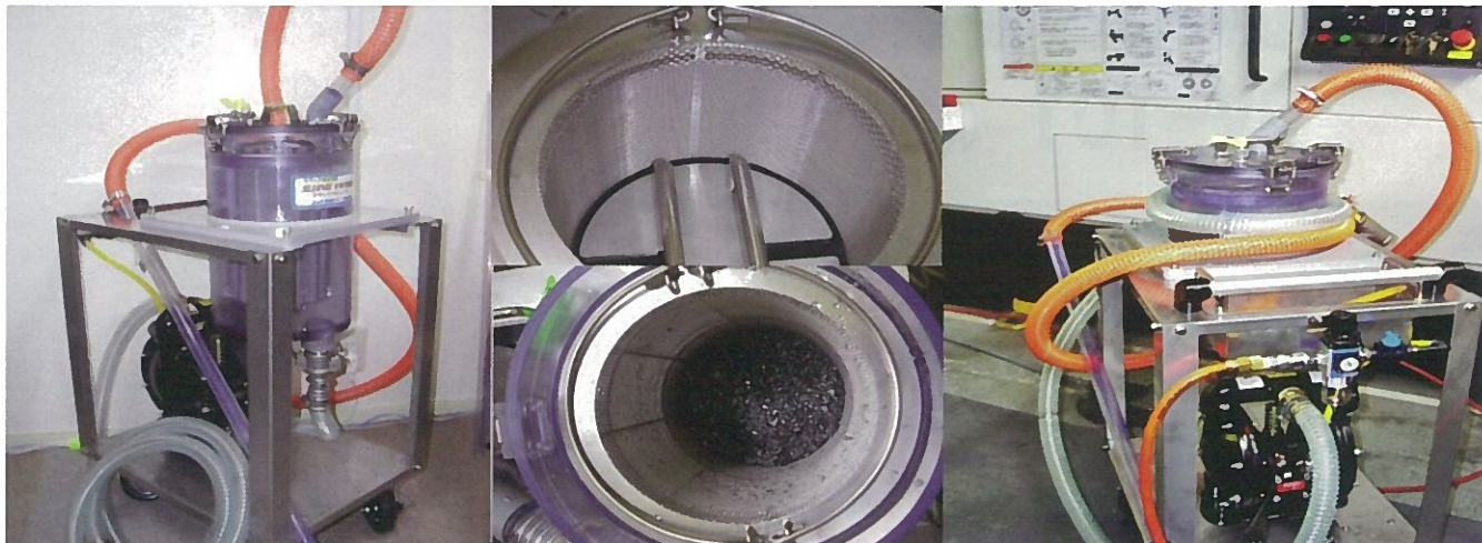
〈スラッジバキューマー外観〉