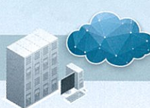
FTPサーバー/クライアント