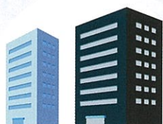
マンション・ビル